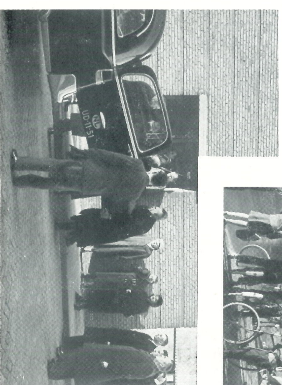
Aankomst van het stoffelijk overschot aan het Personeelsgebouw.