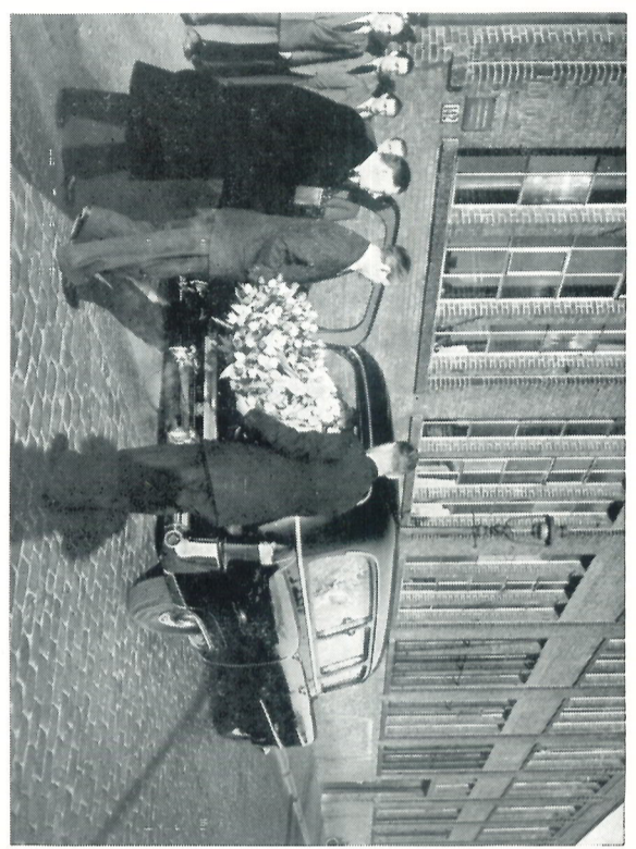
Van links naar rechts boven: Laatste tocht langs de E.N.A.F. Het stille défilé langs de door een dodenwacht van vier vrij- willigers geflankeerde katafalk vormde één der aangrijpendste plechtigheden. De fabriek blijft achter; de vlag halfstok.