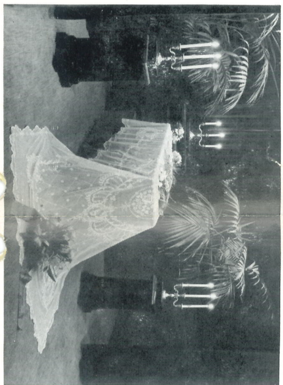
Het stoffelijk overblijfsel in de rouwkamer.