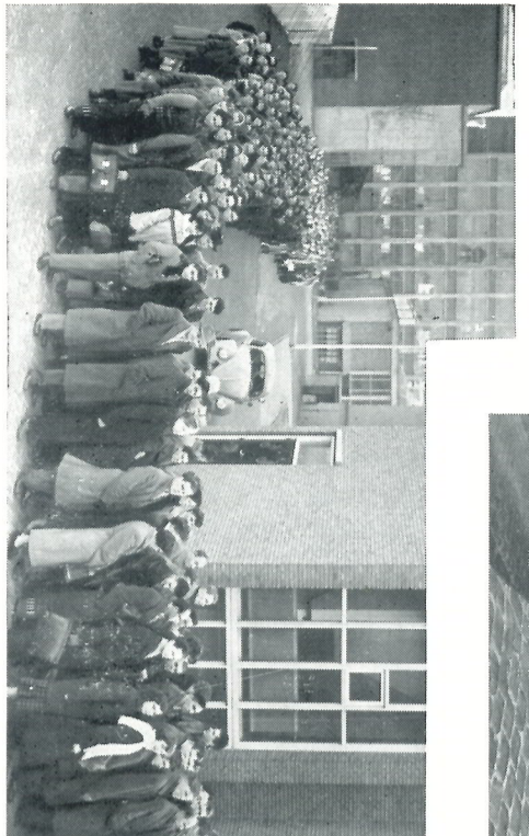
Ondanks de winterkoude wachten vele honderden de gelegenheid af langs hun overleden directeur te defileren.